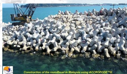
CLAS inspector checks the placement with the contractor